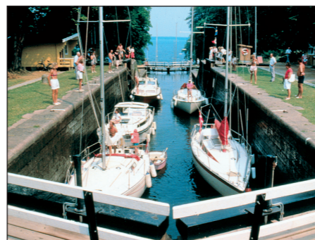
Slussning på Göta kanal.

klosterruin och Mariadötrarnas nybyggda kloster. Här finns också många av Sveriges äldsta kyrkor, Rökstenen, Nässja domarring. Mängder av sevärdheter inom någon mil från campingen!